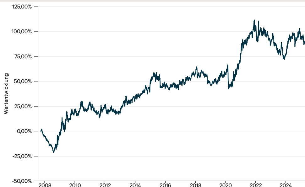
— C-QUADRAT ARTS Total Return Dynamic T (PLN)