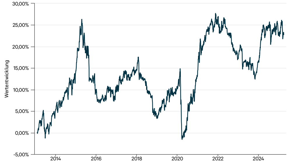
— C-QUADRAT ARTS Total Return Balanced T (CHF hedged)