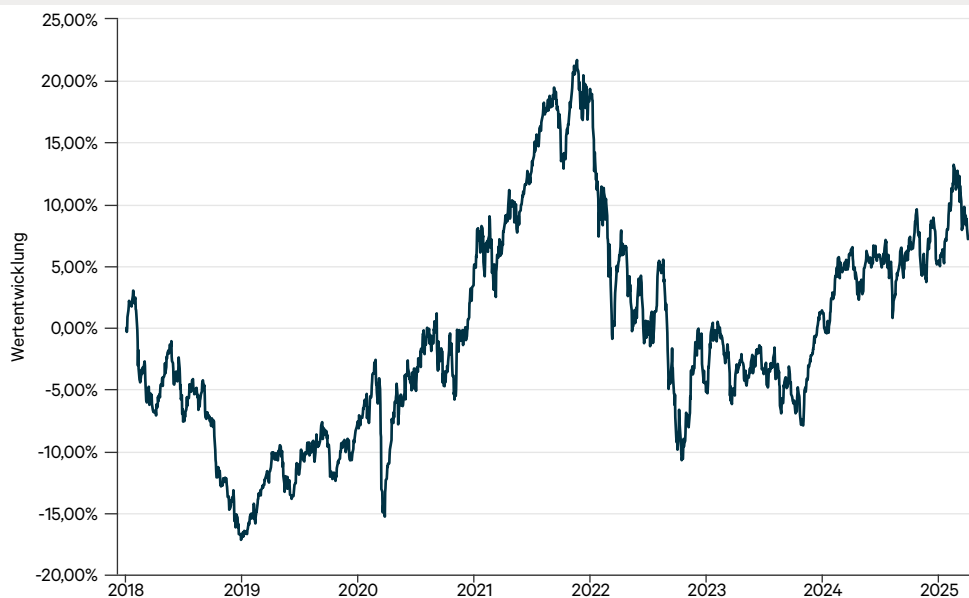
— Mayerhofer Strategie AMI I (a)