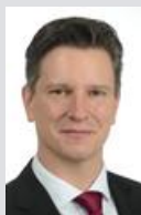
Marc Cujai www.mcvmfonds.com

MC Vermögensmanagement AG FL-9490 Vaduz www.mcvm.li