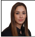
Tiffany Wade Seit Sept 24

Verwaltungsgesellschaft: Threadneedle Man. Lux. S.A. Umbrella-Fonds: Columbia Threadneedle (Lux) I SFDR-Kategorie: Artikel 8 Auflegungsdatum des Fonds: 28.07.00 Index: S&P 500 Index Vergleichsgruppe: Morningstar Category US Large-Cap Growth Equity Fondswährung: USD Fondsdomizil: Luxemburg Fondsvolumen: €342,3m Anzahl der Wertpapiere: 37 Preis der Anteilsklasse: 44,8255 Alle Angaben in EUR