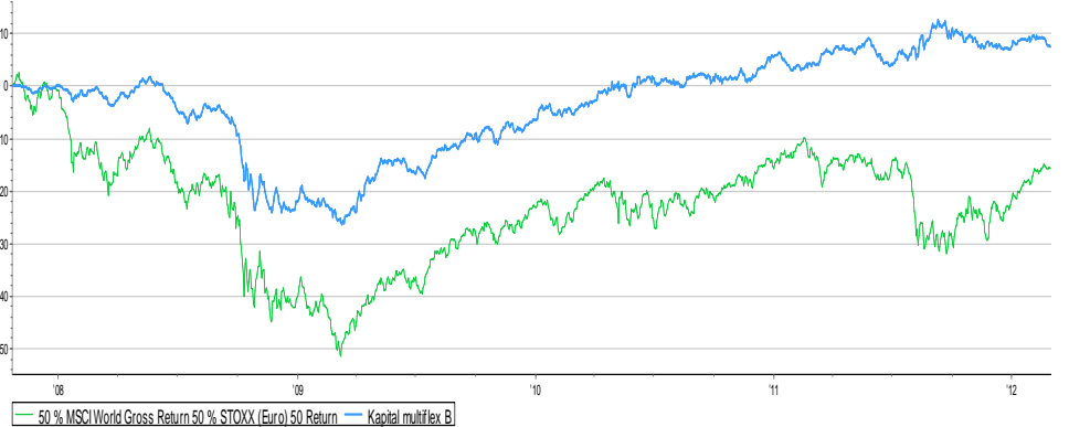
Cumulative Return Chart 10/23/2007 to 02/29/2012