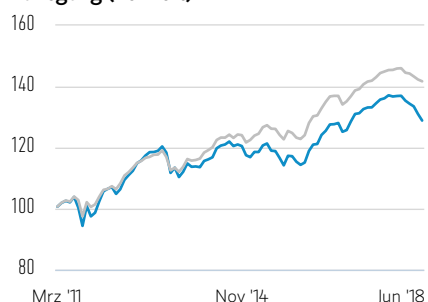
Wertentwicklung einer Anlage von 100 USD seit Auflegung (Barwert)

— Anteile der B-Klasse — JPM Corporate Emerging Markets Bond Index-Broad Diversified Index