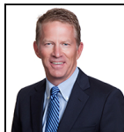
Guy Pope Seit Okt 11

Verwaltungsgesellschaft: Threadneedle Man. Lux. S.A. Umbrella-Fonds: Columbia Threadneedle (Lux) I SFDR-Kategorie: Artikel 8 Auflegungsdatum des Fonds: 12.10.11 Index: - Vergleichsgruppe: - Fondswährung: USD Fondsdomizil: Luxemburg Fondsvolumen: €678,5m Anzahl der Wertpapiere: 77 Preis der Anteilsklasse: 25,6419 Alle Angaben in EUR