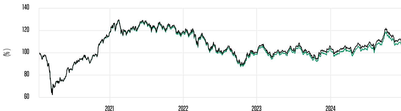
Kumulierte Wertentwicklung per 31.12.2024 (in %)