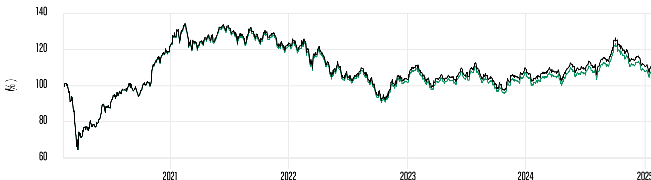
Kumulierte Wertentwicklung per 31.01.2025 (in %)