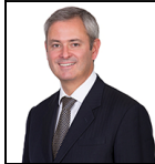
Jeremy A. Smith Seit Nov 22

Verwaltungsgesellschaft: Threadneedle Man. Lux. S.A. Umbrella-Fonds: Columbia Threadneedle (Lux) I SFDR-Kategorie: Artikel 6 Auflegungsdatum des Fonds: 05.10.16 Index: FTSE All-Share Vergleichsgruppe: Morningstar Category UK Equity Income Fondswährung: GBP Fondsdomizil: Luxemburg Ex-Dividendendatum: Vierteljährlich Zahlungsdatum: Vierteljährlich Fondsvolumen: £262,3m Anzahl der Wertpapiere: 42 Preis der Anteilsklasse: 12,6817 Alle Angaben in GBP