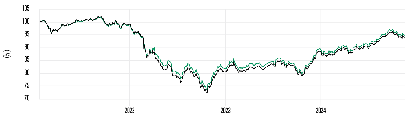
Kumulierte Wertentwicklung per 29.11.2024 (in %)