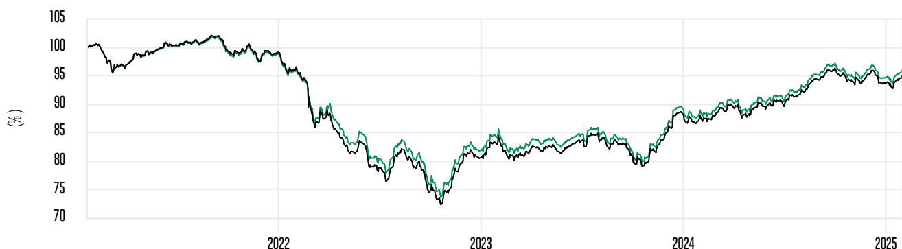
Kumulierte Wertentwicklung per 31.01.2025 (in %)