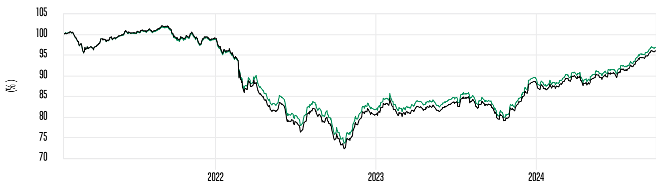
Kumulierte Wertentwicklung per 30.09.2024 (in %)