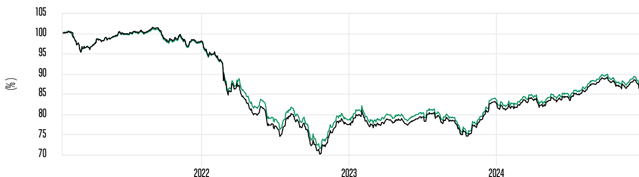
Kumulierte Wertentwicklung per 31.12.2024 (in %)