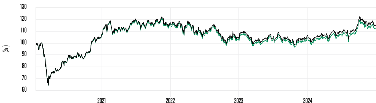
Kumulierte Wertentwicklung per 31.12.2024 (in %)