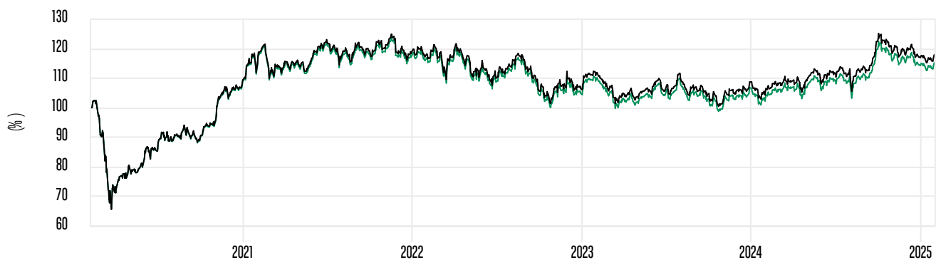
Kumulierte Wertentwicklung per 31.01.2025 (in %)