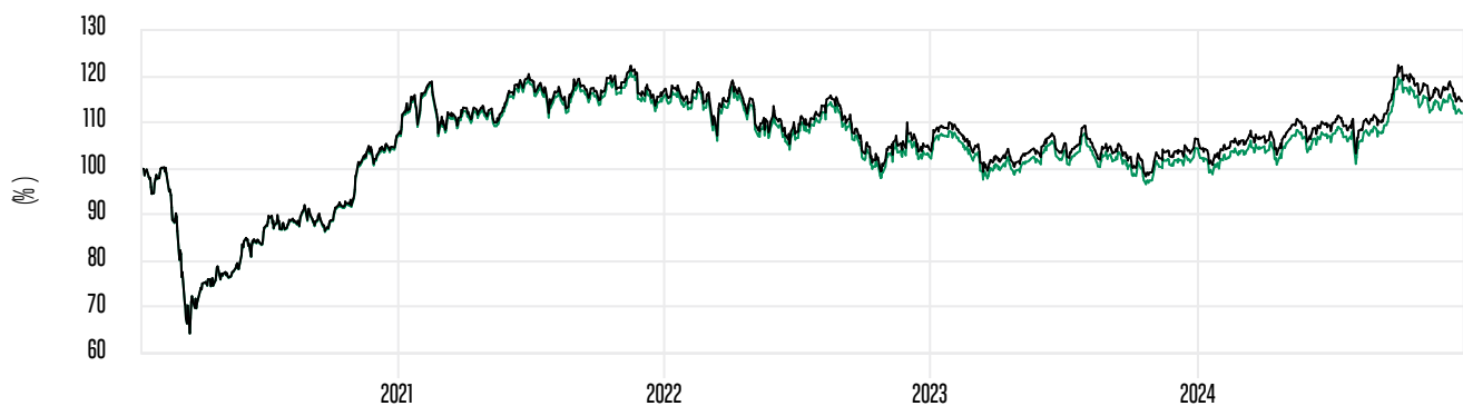
Kumulierte Wertentwicklung per 31.12.2024 (in %)