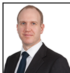
Philip Dicken Seit Aug 18

Verwaltungsgesellschaft: Threadneedle Man. Lux. S.A. Auflegungsdatum des Fonds: 29.08.18