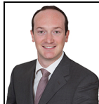
Frederic Jeanmaire Seit Dez 24

Verwaltungsgesellschaft: Threadneedle Man. Lux. S.A. Umbrella-Fonds: Columbia Threadneedle (Lux) I SFDR-Kategorie: Artikel 8 Auflegungsdatum des Fonds: 05.10.18 Index: MSCI Europe Vergleichsgruppe: Morningstar Category Europe Large-Cap Growth Equity Fondswährung: EUR Fondsdomizil: Luxemburg Ex-Dividendendatum: Halbjährlich Zahlungsdatum: Halbjährlich Fondsvolumen: €71,9m Anzahl der Wertpapiere: 41 Preis der Anteilsklasse: 1,2398 Alle Angaben in EUR