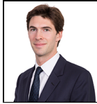
Benjamin Moore Seit Apr 19

Verwaltungsgesellschaft: Threadneedle Man. Lux. S.A. Umbrella-Fonds: Columbia Threadneedle (Lux) I SFDR-Kategorie: Artikel 8 Auflegungsdatum des Fonds: 18.01.12 Index: FTSE World Europe ex UK Vergleichsgruppe: Morningstar Category Europe ex-UK Equity Fondswährung: EUR Fondsdomizil: Luxemburg Ex-Dividendendatum: Annual Zahlungsdatum: Annual Fondsvolumen: €1.649,7m Anzahl der Wertpapiere: 37 Preis der Anteilsklasse: 16,4341 Anlagestil : Der Fonds ist derzeit gegenüber seinem Vergleichsindex auf eine wachstumsorientierte Anlagestrategie ausgerichtet. Das bedeutet, dass der Fonds überwiegend in Unternehmen investiert, die im Vergleich zum Vergleichsindex überdurchschnittliche Wachstumsraten oder ein gutes Wachstumspotenzial (basierend auf Indikatoren wie Gewinn- und Umsatzwachstum) aufweisen. Die Anlagestrategie eines Fonds kann sich im Laufe der Zeit ändern.