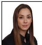
Tiffany Wade Seit Sept 24

Verwaltungsgesellschaft: Threadneedle Man. Lux. S.A. Umbrella-Fonds: Columbia Threadneedle (Lux) I SFDR-Kategorie: Artikel 8 Auflegungsdatum des Fonds: 28.07.00 Index: S&P 500 Index Vergleichsgruppe: Morningstar Category US Large-Cap Growth Equity Fondswährung: USD Fondsdomizil: Luxemburg Fondsvolumen: $355,9m Anzahl der Wertpapiere: 37 Preis der Anteilsklasse: 9,4567 Alle Angaben in USD