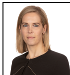
Georgina Hellyer Seit Nov 24

Verwaltungsgesellschaft: Threadneedle Man. Lux. S.A. Umbrella-Fonds: Columbia Threadneedle (Lux) I SFDR-Kategorie: Artikel 8 Auflegungsdatum des Fonds: 23.10.18