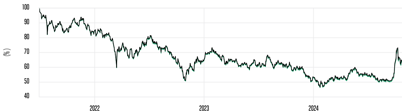
Kumulierte Wertentwicklung per 31.10.2024 (in %)