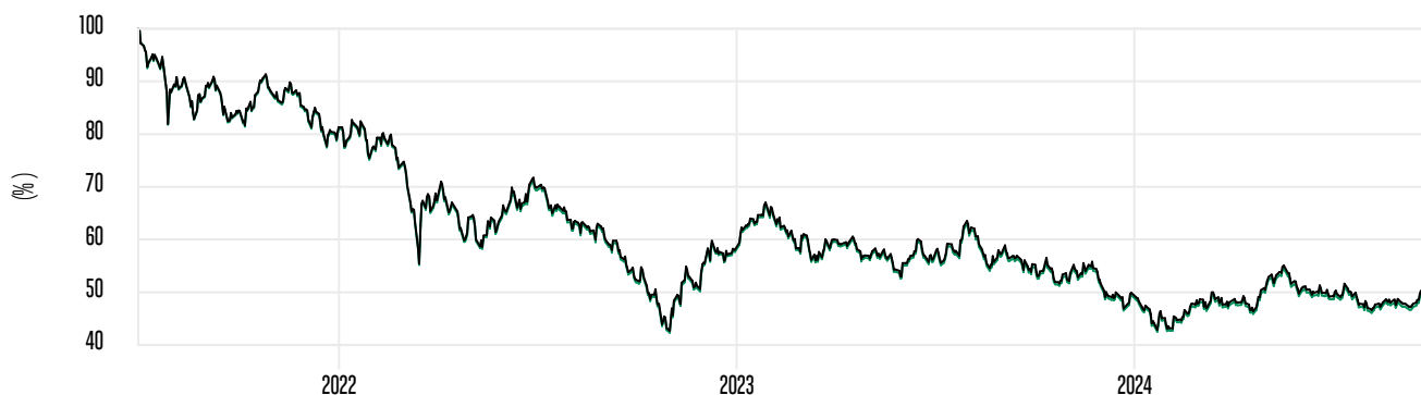
Kumulierte Wertentwicklung per 30.09.2024 (in %)