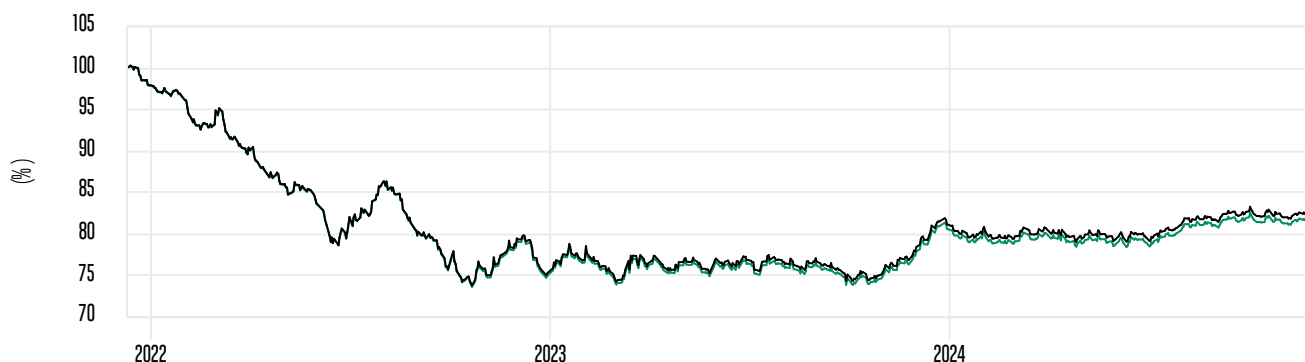
Kumulierte Wertentwicklung per 29.11.2024 (in %)