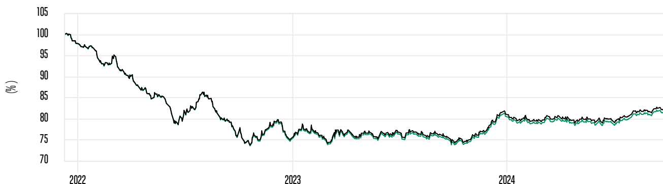
Kumulierte Wertentwicklung per 30.09.2024 (in %)