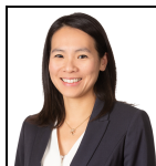
Tammie Tang Seit Dez 23

Verwaltungsgesellschaft: Threadneedle Man. Lux. S.A. Umbrella-Fonds: Columbia Threadneedle (Lux) I SFDR-Kategorie: Artikel 9 Auflegungsdatum des Fonds: 05.12.23 Fonds: - Index: - Vergleichsgruppe: - Fondswährung: USD Fondsdomizil: Luxemburg Ex-Dividendendatum: annual Zahlungsdatum: annual Fondsvolumen: €7,1m Anzahl der Wertpapiere: 113 Preis der Anteilsklasse: 10,4409 Alle Angaben in EUR