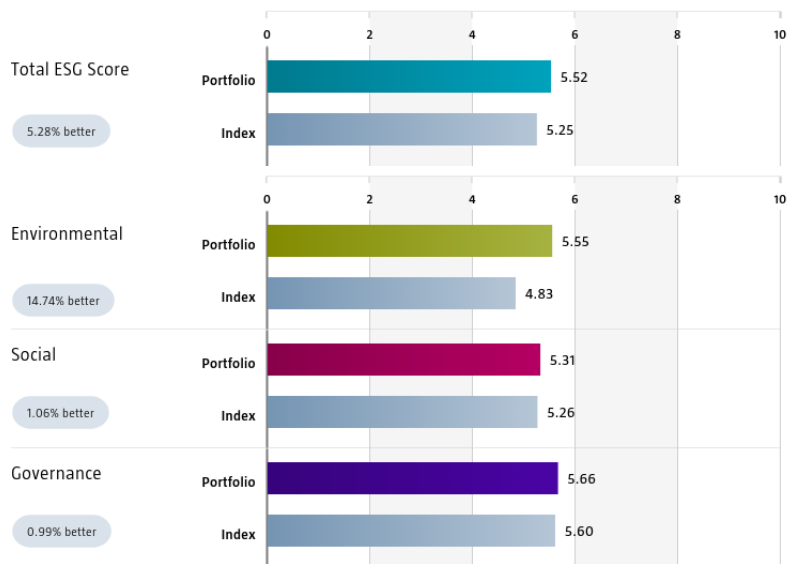
Source: Robeco. Certain underlying data is sourced from third parties (such as e.g. IMF, OECD and World Bank including Worldwide Governance Indicators Control of Corruption, as well as content from ISS and SanctIO).

Die Diagramme zeigen die mithilfe der Methode für das Country Sustainability Ranking von Robeco ermittelten Gesamt-, Umwelt-, Sozial- und Unternehmensführungsscores des Portfolios an. Sie werden unter Verwendung der Gewichtungen und Scores der jeweiligen Länder für die Bestandteile des Portfolios berechnet. Bei den Scores werden mehr als 50 separate Indikatoren berücksichtigt, die jeweils ein eigenes Nachhaltigkeitsmerkmal entlang der Dimensionen Umwelt, Soziales und Unternehmensführung auf Länderebene erfassen. Index-Scores werden zusammen mit den Portfolio-Scores angegeben, um die relative ESG-Leistung des Portfolios zu verdeutlichen. Die Zahlen enthalten nur als Staatsanleihen gekennzeichnete Positionen.